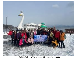
海外インフルエンサー 招聘の様子