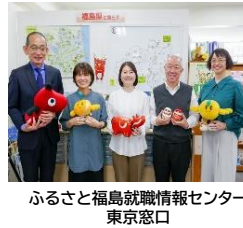
ふるさと福島就職情報センター 東京窓口

テクノアカデミーにおける次世代航空関連産業に関する 講義時間数：<894/500H>