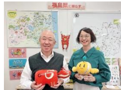
ふるさと福島就職情報センター 東京窓口