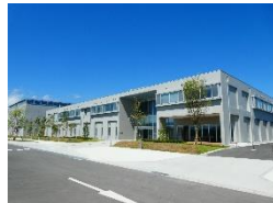
福島ロボットテストフィールド