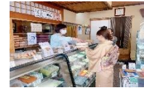
飯坂温泉街歩きモニターツアー