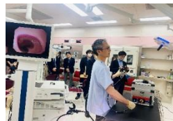
県内企業が開発に関わった次世代医療機器