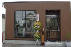
事業再開した事業者