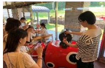
台湾インフルエンサー招請