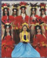
フラダンス ハーラウラーナー 29日