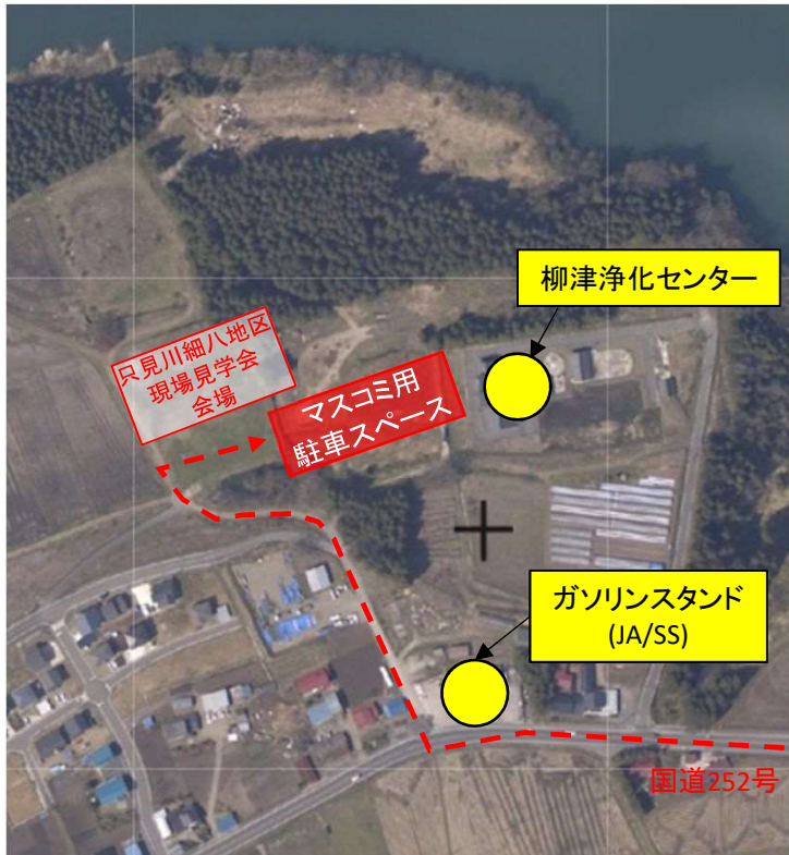
地理院地図を加工して作成