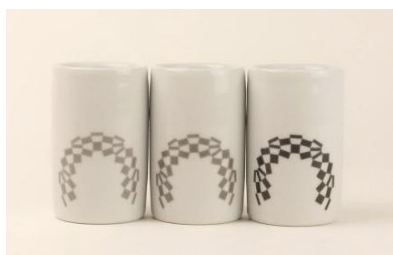
東京2020オリンピック 大堀相馬焼「ぐい呑み」(1セット3個入り)