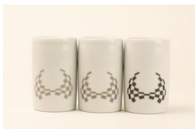
東京2020パラリンピック 大堀相馬焼「ぐい呑み」(1セット3個入り)