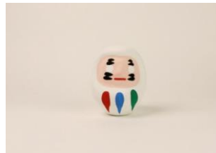
東京2020パラリンピック 白河だるま「白河だるま」※3月下旬発売予定