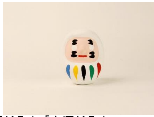
東京2020オリンピック 白河だるま「白河だるま」