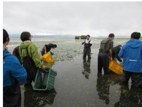
活動支援研修の様子