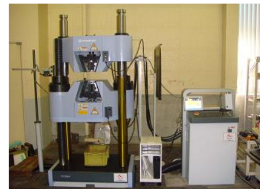
万能試験機 (UH-F1000kNX) (5,140円/時間)

○その他の施設・設備は、福島県ハイテックプラザ 施設・設備データベースからご覧いただけます。