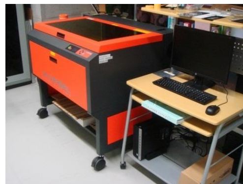
レーザー式精密加工機 (2,070円/時間)