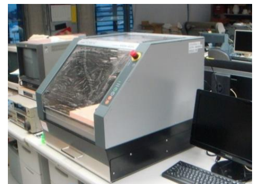
卓上型NC加工機 (860円/時間)

○その他の施設・設備は、福島県ハイテクプラザ 施設・設備データベースからご覧いただけます。