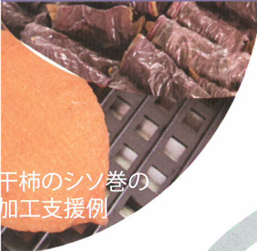
干柿のシソ巻の加工支援例