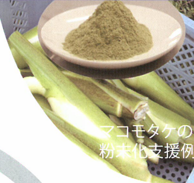
マコモタケの粉末化支援例