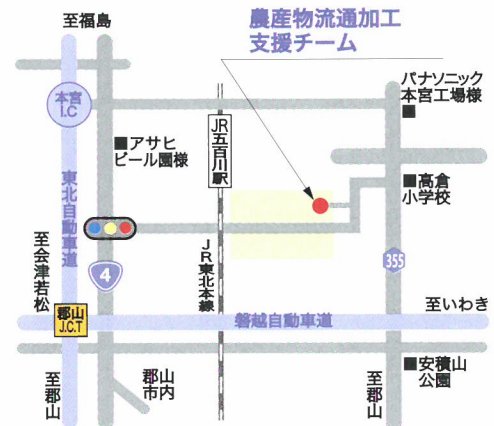
農産物流通加工 支援チーム