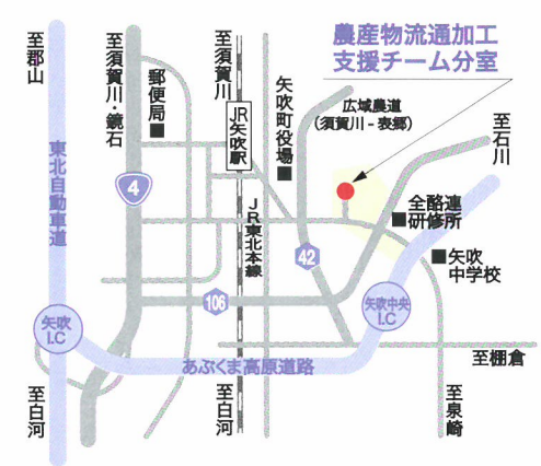
農産物流通加工 支援チーム分室

ハイテクプラザ 会津若松技術支援センター 〒965-0006 会津若松市一箕町鶴賀字下柳原88番地1 TEL.0242-39-2974(企画)・TEL.0242-39-2977(食品加工) FAX.0242-39-0335