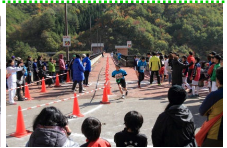
ひのき駅伝大会参加の皆様

☆工事完了箇所数は7割を超えました！！ ☆年度内完成を目指して全力で取り組みます！！