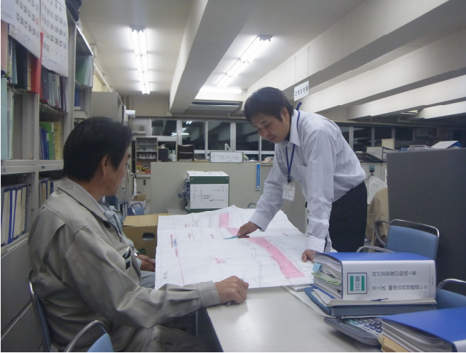
11月11日 打合せは夜も続く