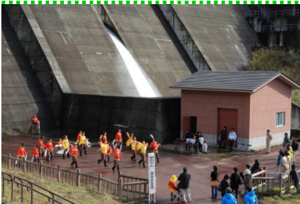
「よさこい凧道」の皆様による 開会式オープニングセレモニー

さらに、まつり当日から、田島ダムのダムカード配布を開始しました。ダムカードを求めて県外から訪れた方もおり、たくさんの方に田島ダムを知ってもらう機会となりました。