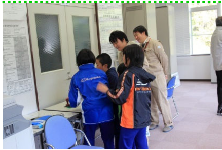
ウォークラリー参加の皆様