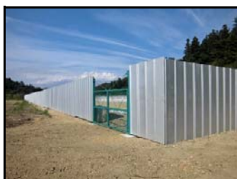
仮置場での遮へい作業