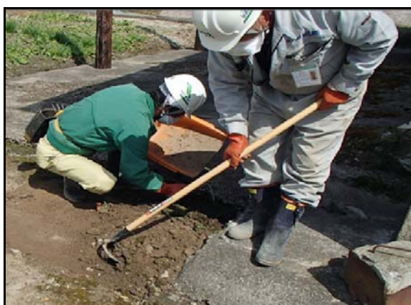
土壌剥ぎ取り作業