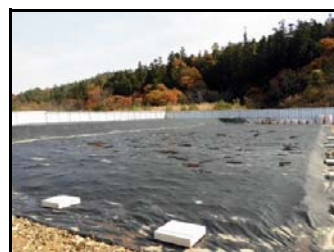
完成された仮置場