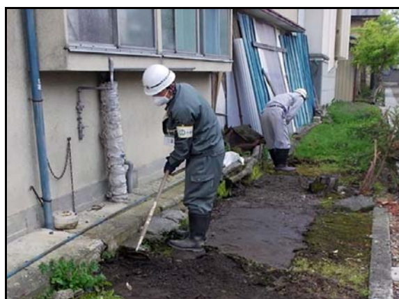
土壌剥ぎ取り作業