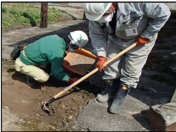
土壌剥ぎ取り作業