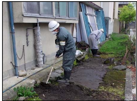
土壌剥ぎ取り作業