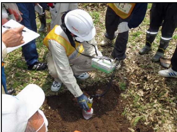
コリメータ使用し線量確認