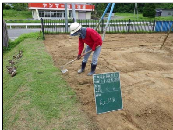
校庭除染工事表土剥取