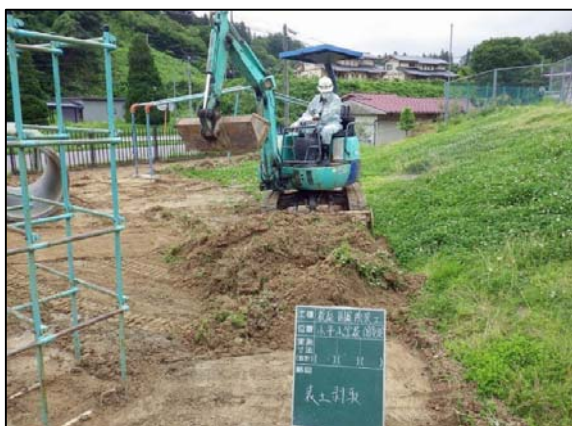
校庭除染工事表土剥取