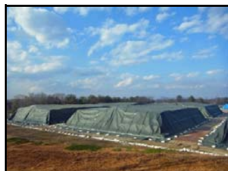
陸上競技場仮置場