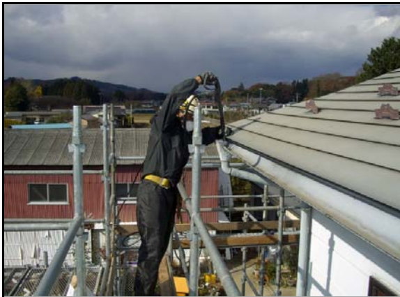
縦樋除染作業状況