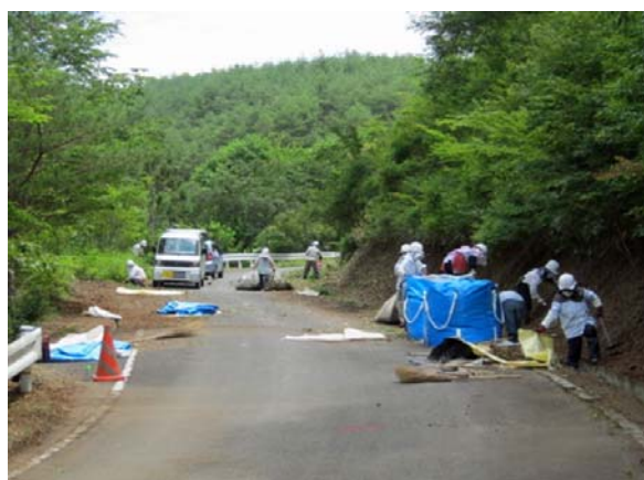
住宅除染での表土の剥ぎ取り作業