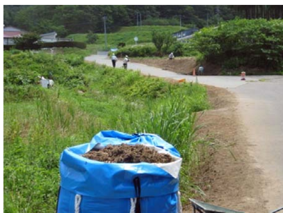
道路除染での側溝堆積物の除去作業