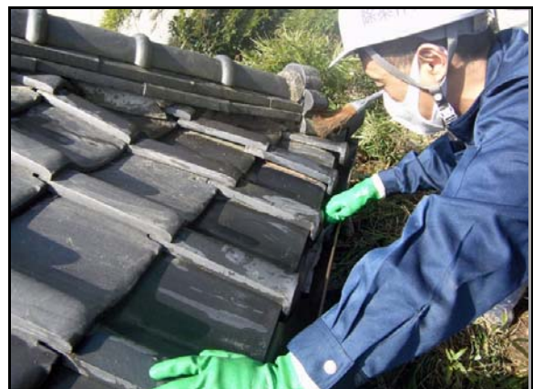
屋根拭き取り状況