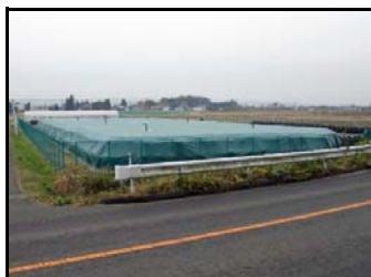
根岸熊ノ前仮置場