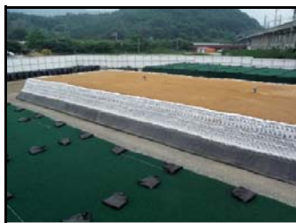
土のうで遮へいし、 遮水シートで覆う前の状況