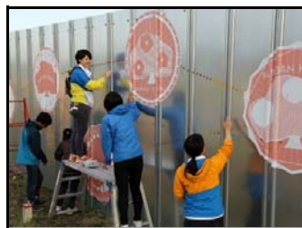
仮置場外壁にデザイン画で装飾