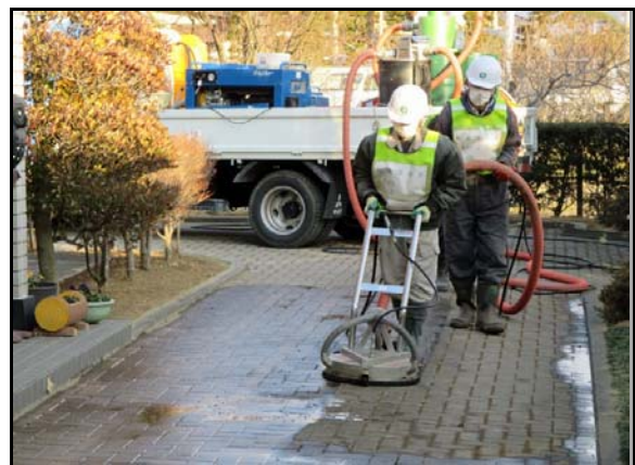
回収型高圧洗浄機による作業