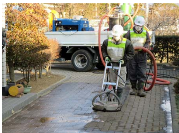
回収型高圧洗浄機による作業