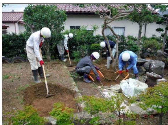
除染作業(表土除去作業)