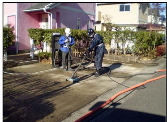
コンクリート洗浄作業