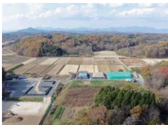
除去土壌の格納状況