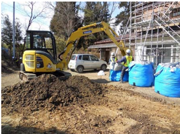
地表面の除染及び汚染土の袋詰め