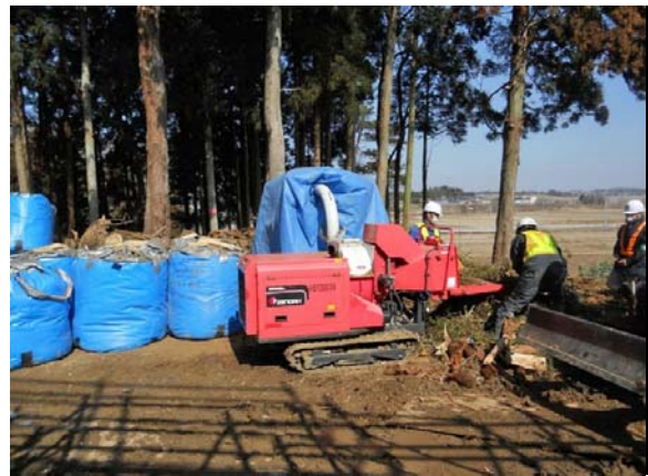
枝打ち後の破碎及び袋詰め