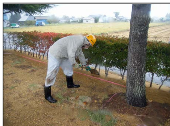
役場周辺除染(客土)