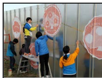
仮置場外壁にデザイン画で装飾