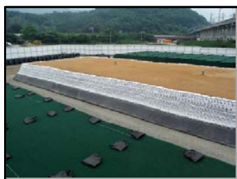
土のうで遮へいし、 遮水シートで覆う前の状況