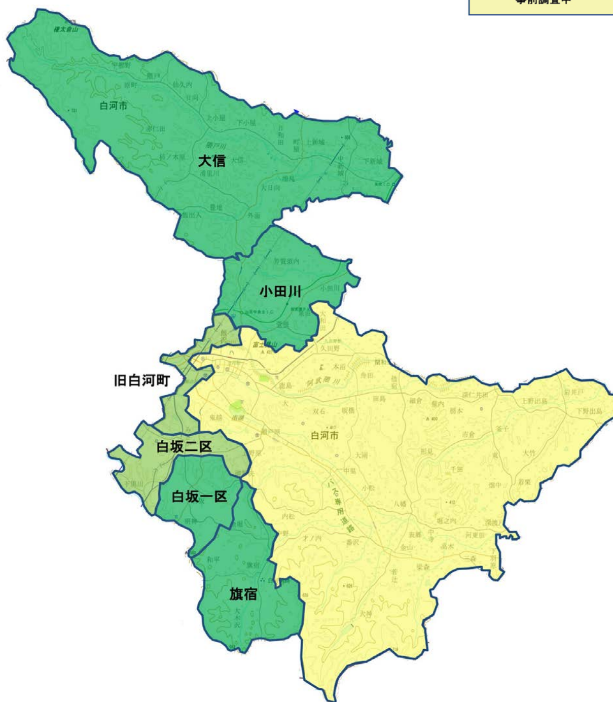
住宅除染進捗図(平成26年12月末時点)