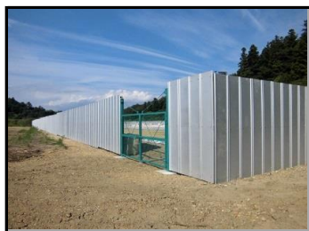
仮置場での遮へい作業