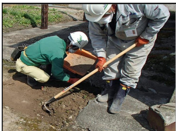
土壌剥ぎ取り作業