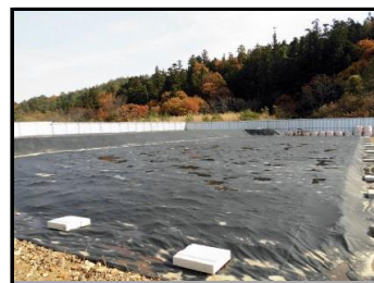
完成された仮置場