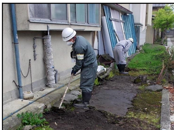
土壌剥ぎ取り作業