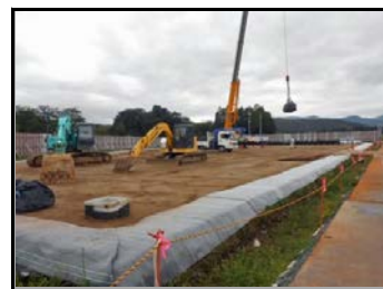
仮置場造成・搬入状況