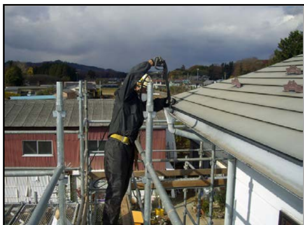
縦樋除染作業状況