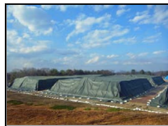
陸上競技場仮置場