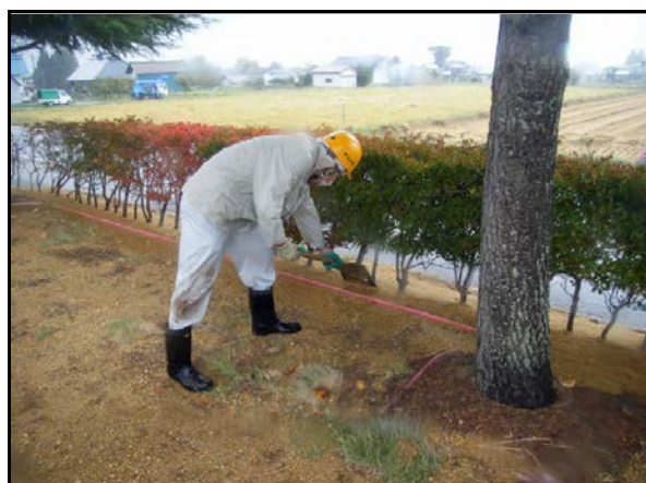
役場周辺除染(客土)