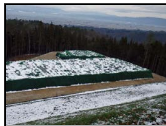
完成された仮置場