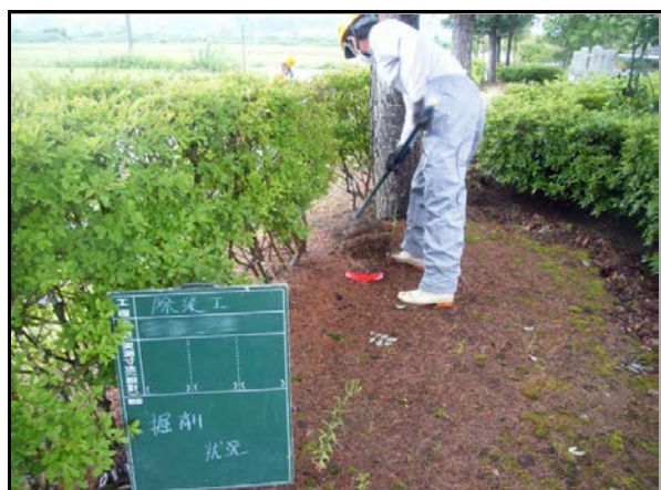
役場周辺除染(表土の剥ぎ取り)