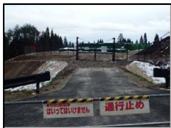
仮置場での遮へい作業