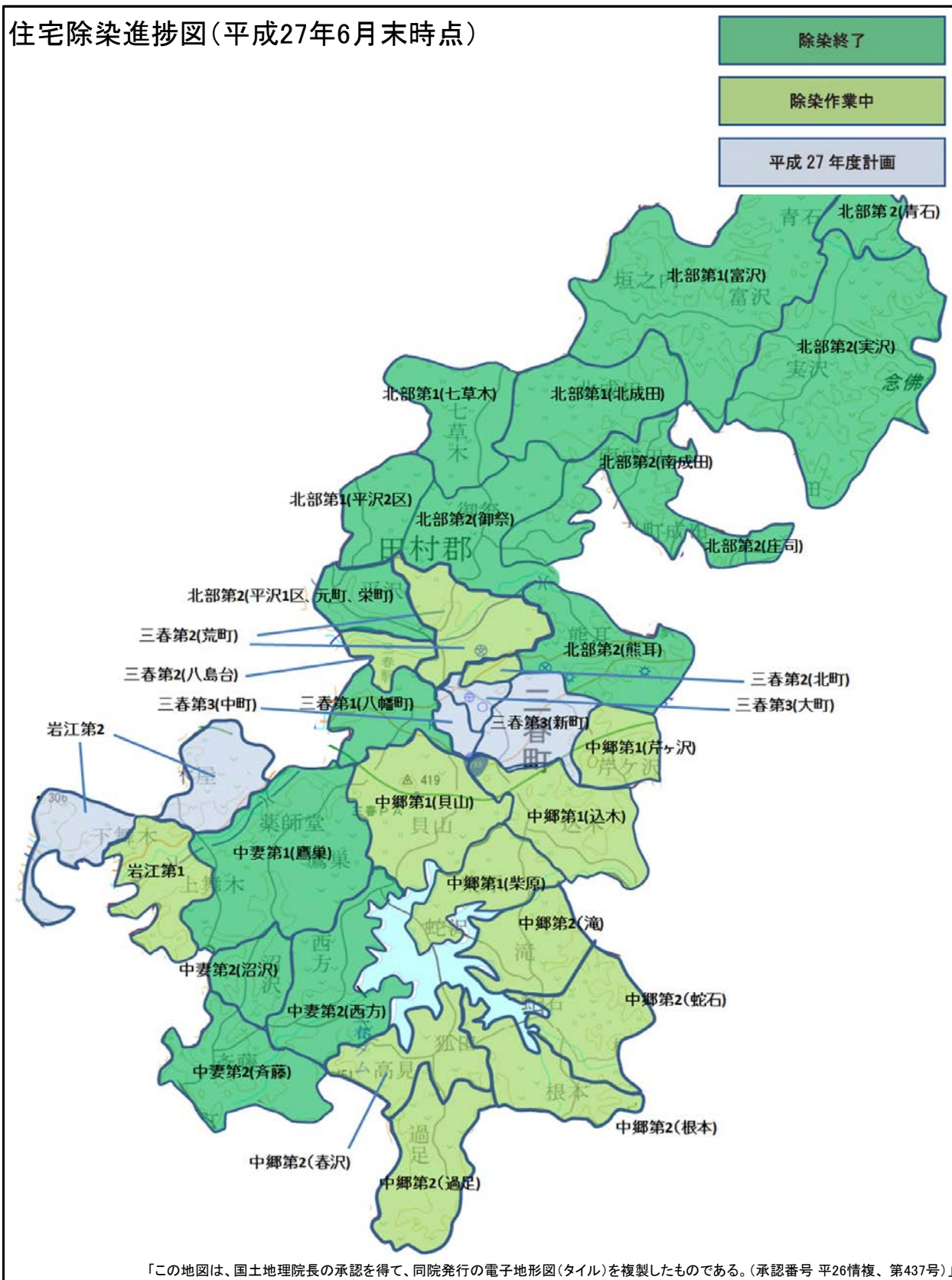
住宅除染進捗図(平成27年6月末時点)