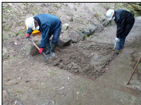
夏井地区除染作業