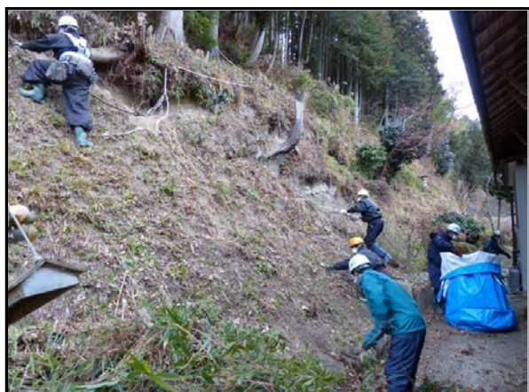
夏井地区除染作業