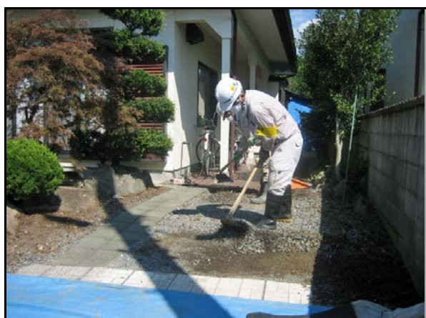
砂利・碎石の除去