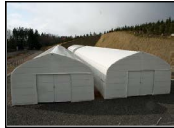
仮置場（裏側から撮影）