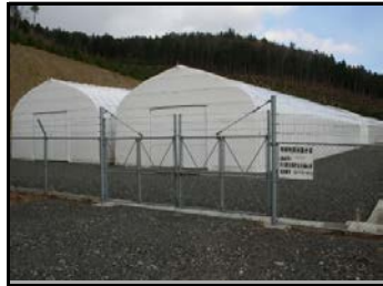
仮置場（入り口側から撮影）