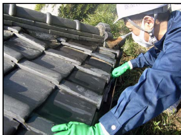
屋根拭き取り状況