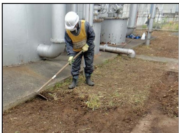
表土剥ぎ取り状況