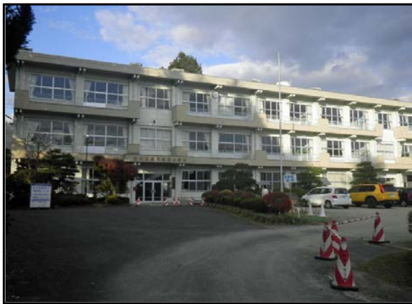
除染現場 (里白石小学校)