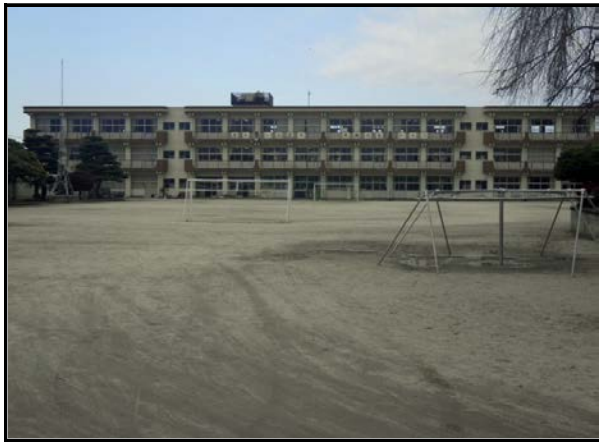
除染現場 (浅川小学校)