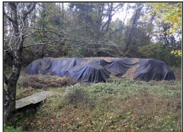
現場保管 (山白石小学校)