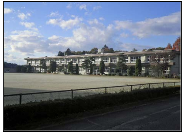
除染現場 (山白石小学校)