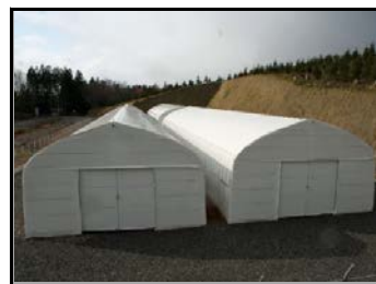
仮置場（裏側から撮影）