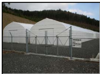
仮置場（入り口側から撮影）