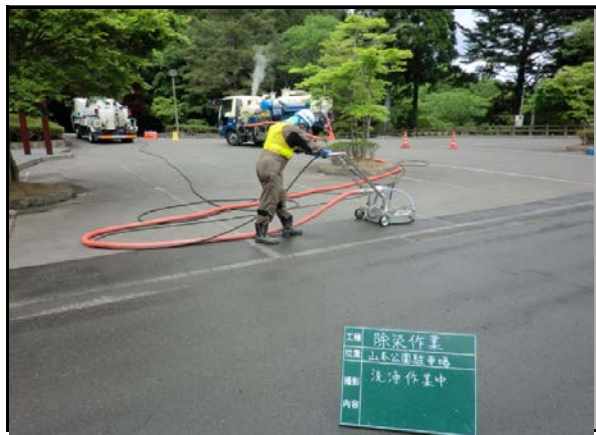
山本公園駐車場除染状況