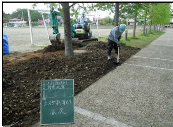
社川小学校除染状況