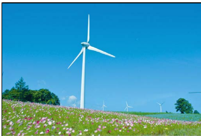
郡山布引風の高原

(解説) 郡山市湖南町にある布引高原は、33基の風力発電用風車が立ち並び、磐梯山や猪苗代湖が一望できる風と緑があふれる観光スポットである。