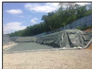
郡山市日和田町高倉地内の 仮置場