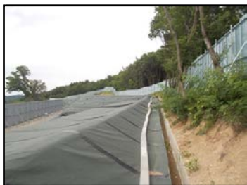
郡山市日和田町高倉地内の 仮置場