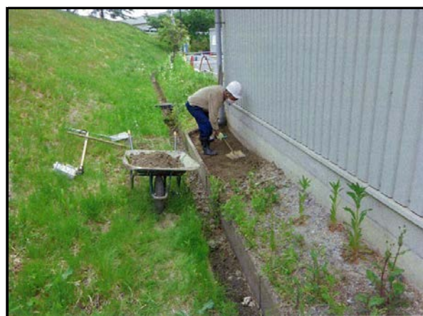
除染(表土剥ぎ取り)