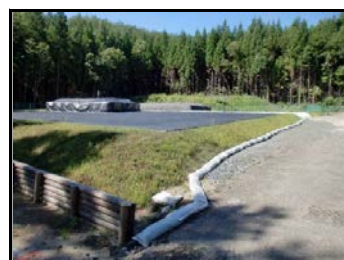
手前: 2号(不燃物)置場 奥: 3号(可燃)置場