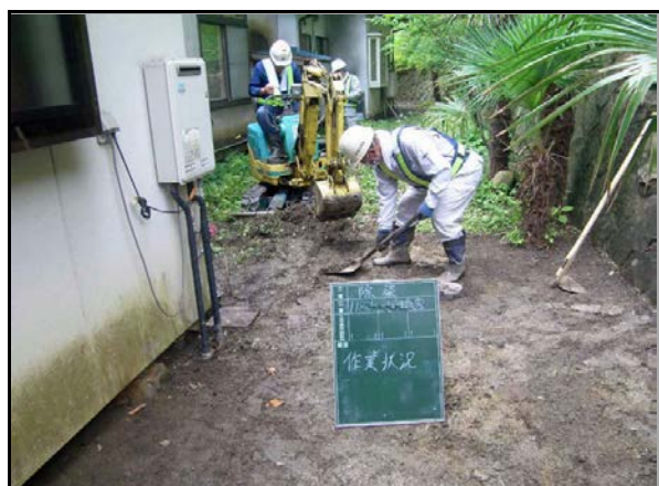
表土剥ぎ取り作業