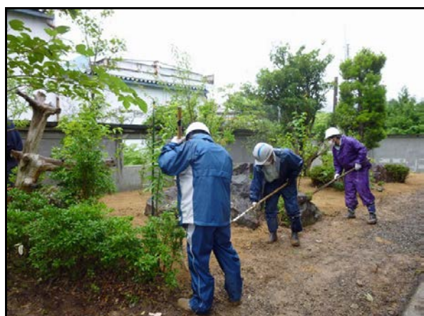
住宅除染実施状況