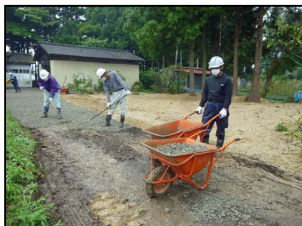
住宅除染実施状況