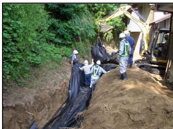
フレコン埋設作業