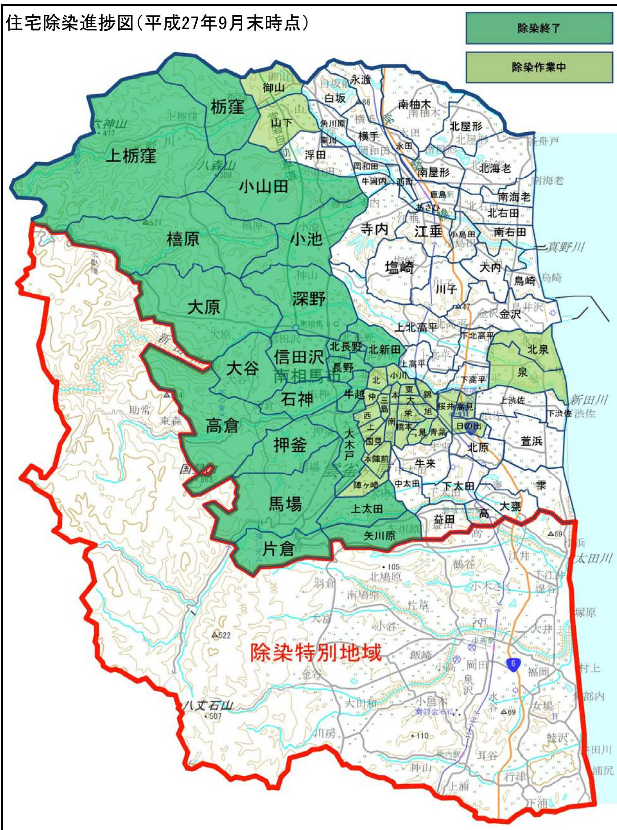
住宅除染進捗図(平成27年9月末時点)