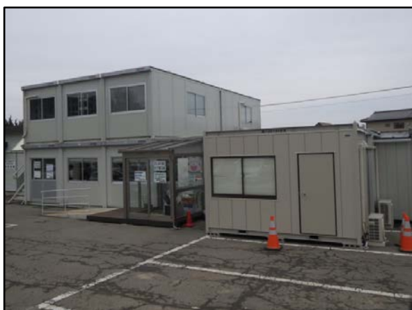
西郷村放射能対策課事務室