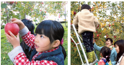
11月に果樹園で「リンゴ狩り」を開催

「遊ぶ時間がないな」と思ったら、お子さんと近所のお店まで「歩いてお買い物」。外を歩くと、目に入るものの興味から自然と会話が弾みます。お子さんにあえて荷物を持ってもらうと、体力と「つらいことへの耐性」がきますよ。ご自身の健康増進にもなりますね(笑)。 仕事と子育ての両立に忙しい方は、私たち子育て支援団体が企画するイベントも利用してください。事前準備の必要なく遊べますよ。