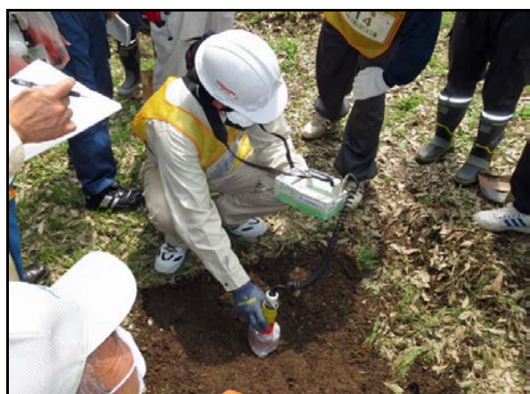
コリメータ使用し線量確認