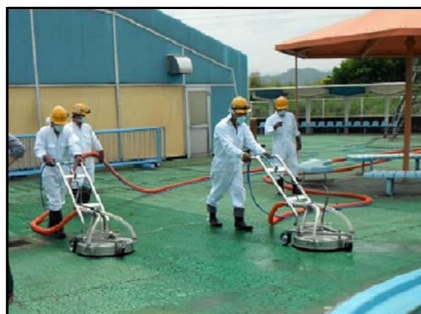
同時吸引型高圧洗浄実施