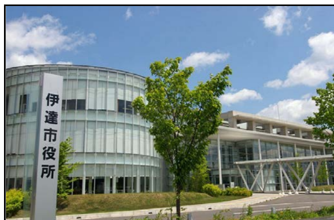
伊達市役所 保原庁舎