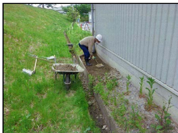
除染(表土剥ぎ取り)