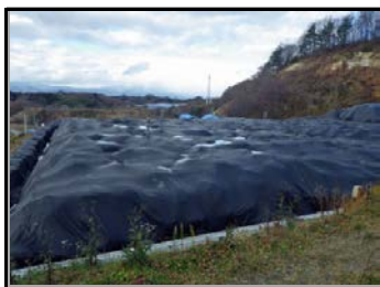
除去土壌等を遮水シートで覆って保管