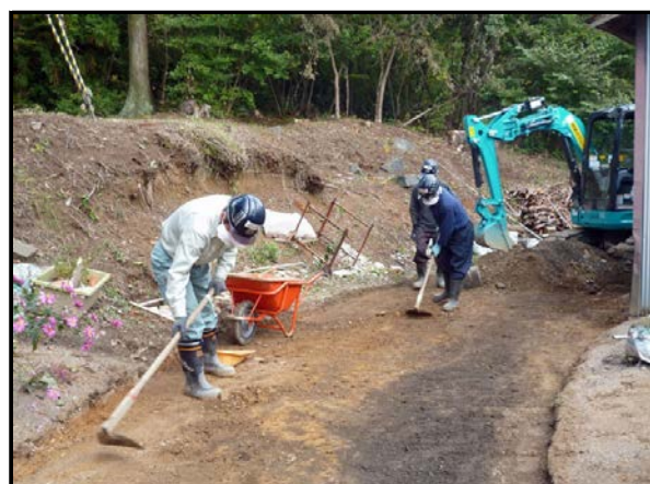
住宅周りの表土除去