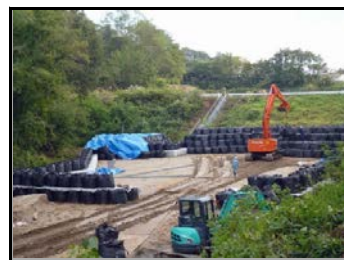
周辺を遮へい土のうで覆い、除去土壌等を据付