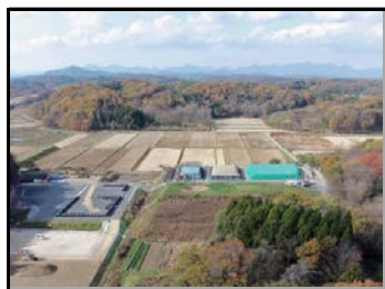
除去土壌の格納状況