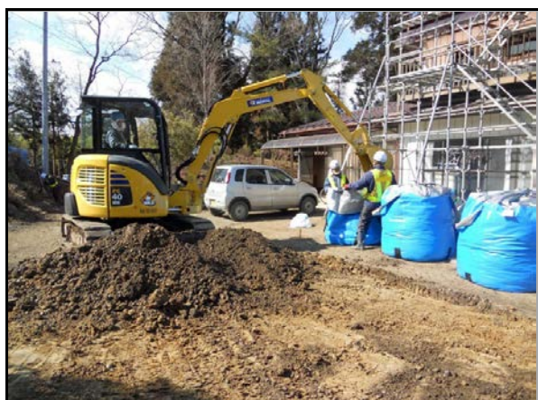
地表面の除染及び汚染土の袋詰め