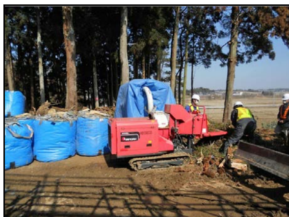
枝打ち後の破碎及び袋詰め