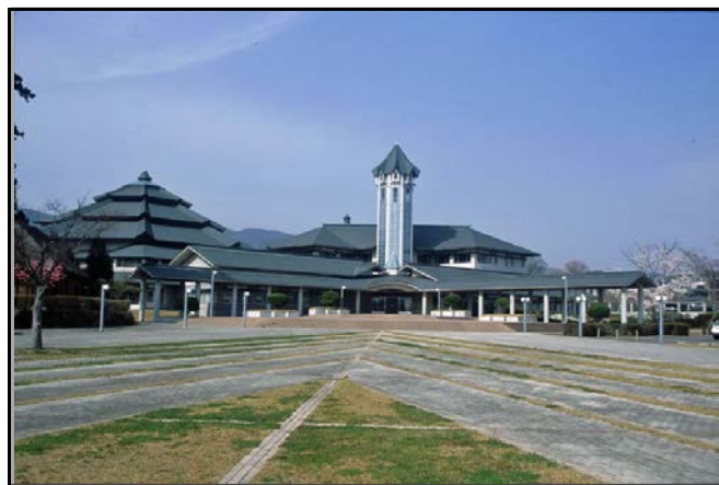
国見町役場仮庁舎(国見町観月台文化センター)