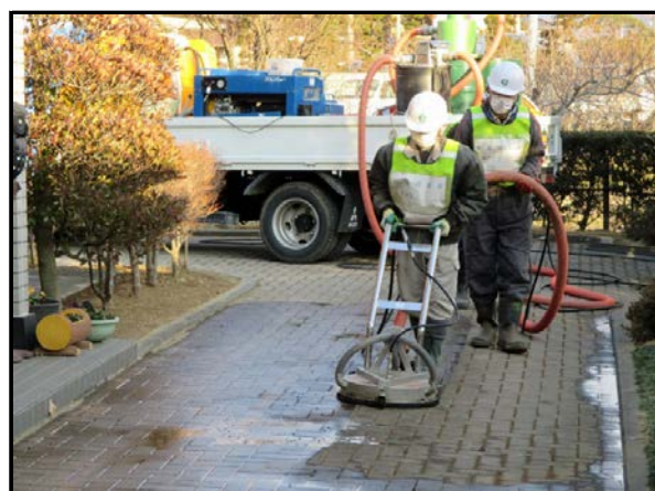
回収型高圧洗浄機による作業