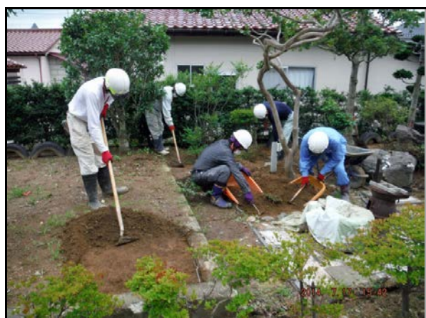
除染作業(表土除去作業)