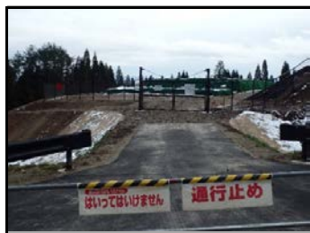
仮置場での遮へい作業